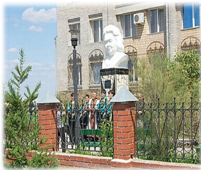
Зәйнәб Бишшева исемендәге БДПУ

Яуа ямғыр, яуа бер өзлөкһөз. Тәзрәмдә бейей тамсылар. Ниңә бейей, ниңә арыу белмәй, Йәнгә тынғы бирмәй тамсы ла.